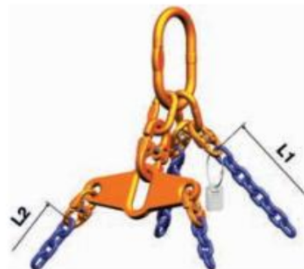
Tabela parametrów technicznych rozdzielacza AGWW w klasie 10