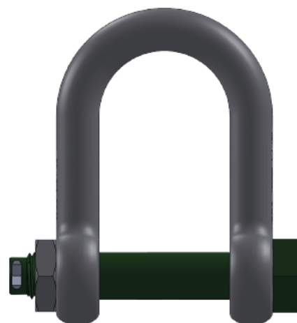
Tabela parametrów technicznych szakli podłużnej z zabezpieczeniem typu szerokiego